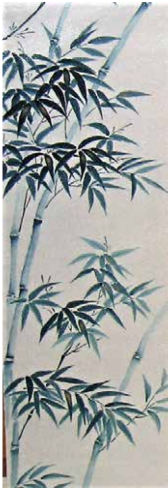
手描き友禅の美「竹」袋帯