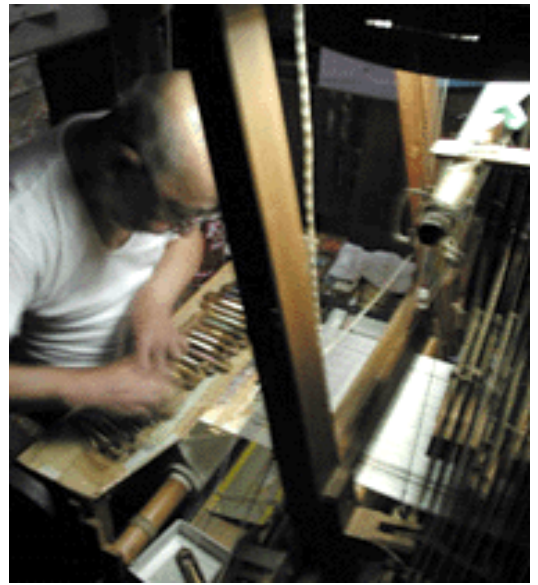
【伝統工芸】を身近なものに 写真:手織りの光景