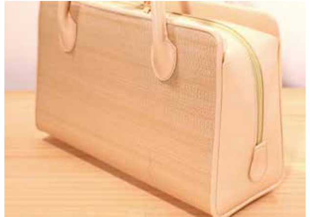
よそゆきにも使える洗練された雰囲気 実は「黒」が一番人気です