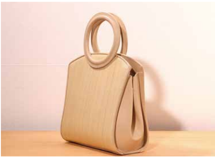
品のある趣きが魅力の「和洋折衷」