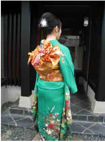
今回の帯結びは「立矢扇」 いろんな帯結びがある中で 雰囲気がとてもよくお似合いです！