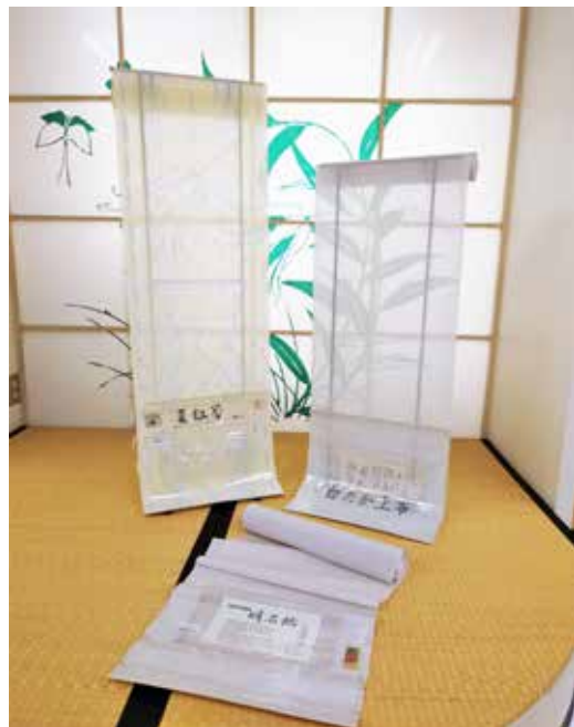
暑い時には涼しいものを。季節を取り入れた着物の装いは素敵ですよ♪↑夏の透けもの 左：夏紅花 中央：明石縮 右：白鷹上布