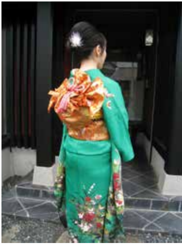
今回の帯結びは「立矢扇」 いろんな帯結びがある中で 雰囲気がとてもよくお似合いです！