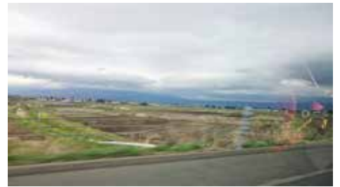
磐越道 会津若松、磐梯山が見えてきます ここを通ったら、いつものあのラーメン!!