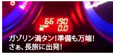
ガソリン満タン!準備も万端! さあ、長旅に出発!

元号が変わる その時は、高速道路 4月30日午後11時自宅を出発。目的地は日本列島を横断して東北は仙台へ。2年ぶりに家族そろって妻の実家に帰省です。交通手段は、いつもの通り「車」です。 今年のゴールデンウィークは長いので、渋滞も覚悟していましたが、あれよあれよという間に京都を過ぎて、午前7時に