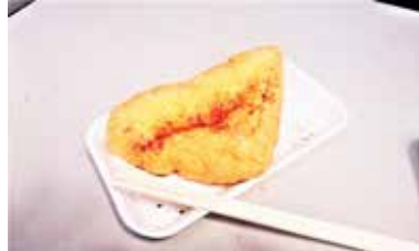
地元の人に愛される「おあげ」

正式名称は定義如来西方寺といい、八百年の歴史があるそうです。一生に一度の願いが叶うと有名で、多くの参拝者がきています。