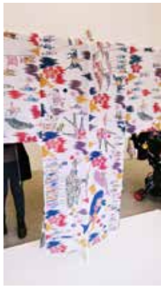
紅型着物の展示とプール

は、石川県に入りました。予定より早そうなので、金沢で途中下車。車での移動は自由が効いて良いですね。東北出身の妻は、石川県初体験。折角なので、いつかは行ってみたいと思っていた「金沢21世紀美術館」へ。