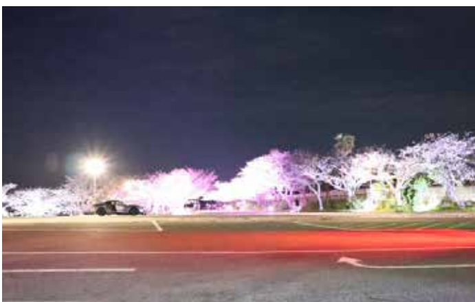
常盤公園湖水ホールの駐車場 ライトアップされて凄くきれいでした ここが感動したシーンなのですが（笑）