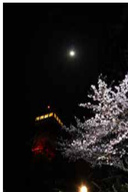
月とタワーとSLの灯

その分、シャッターチャンスが無制限状態です。慣れないカメラを片手にパチパチ撮り、この時とばかりに自分の腕ではなくて、カメラの性能を試します。（苦笑い）