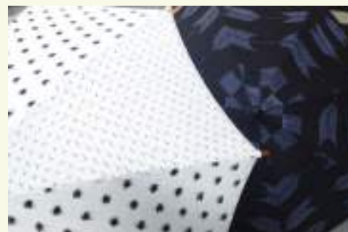
緋の柄が素敵です

こちらの傘は、久留米緋の生地を用いたグッドデザイン賞の受賞歴 もある優れもの。製作秘話もあるのですが興味ある方はぜひ(^▽^)/